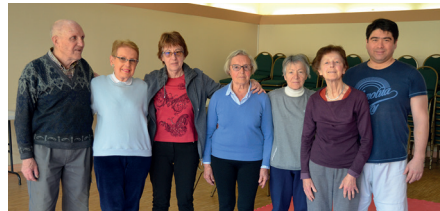
Quelques-uns des participants de l'atelier Equilibre

On profite des enseignements de l'Ecole de Sabre à tout âge. Désireuse d'apporter son concours à nos aînés dans une recherche de mieux vivre et pour les protéger du principal fléau qui pourrait les menacer, l'Ecole de Sabre a mis au point un programme sur mesure contre les chutes, en suivant un programme homologué à l'échelon international par les organismes de santé publique.