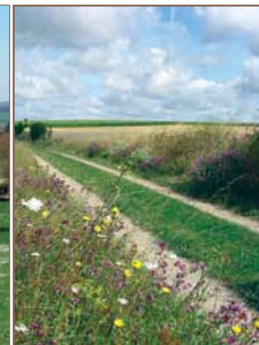
Vallée de l'Aubette.