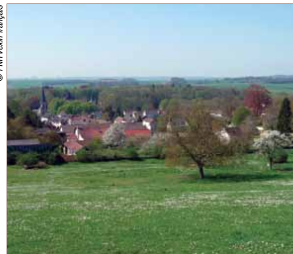
Vue sur le village de Vigny.